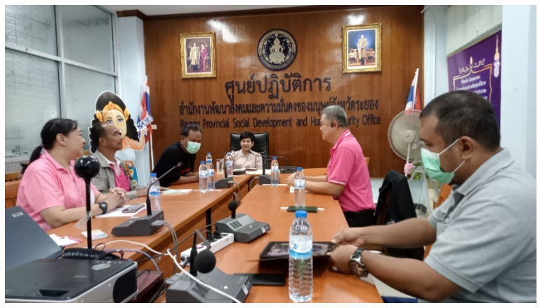
วันที่ 3 ตุลาคม พ.ศ. 2566 ประชุมหารือกับ พมจ. ระยอง ปัญหาคนไร้บ้าน