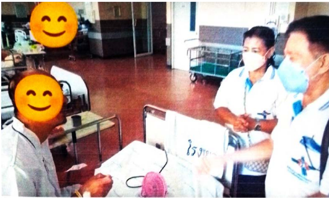
วันที่ 12 /10/2566 ประสานการใช้สิทธิบัตรทองห้องสบายใจ รพ.สมุทรปราการ