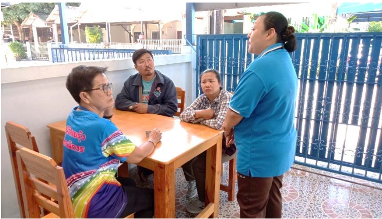
วันที่ 6 พฤศจิกายน พ.ศ. 2566 ให้คำปรึกษาสิทธิบัตรทอง แก่ประชาชนทั่วไป