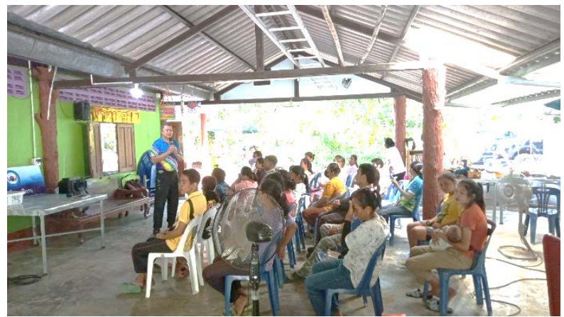
วันที่ 12 ตุลาคม พ.ศ. 2566 ให้ความรู้สิทธิบัตรทอง ตำบลบ้านนา อำเภอกาญจนบุรี จังหวัดระยอง