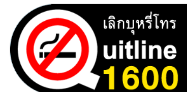
บริการสายด่วนเลิกบุหรี่