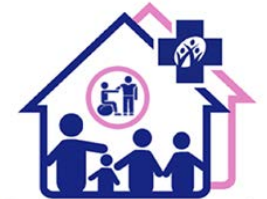
คลินิกกายภาพบำบัดชุมชนอบอุ่น สำนักงานหลักประกันสุขภาพแห่งชาติ