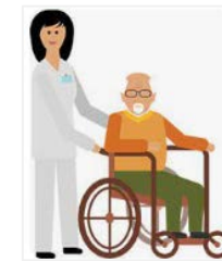
บริการผู้ป่วยระยะกลาง (IMC)