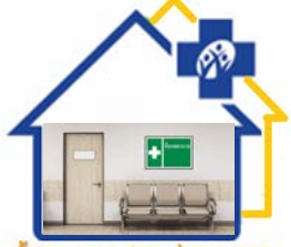
ห้องพยาบาล สถานประกอบการ สำนักงานหลักประกันสุขภาพแห่งชาติ