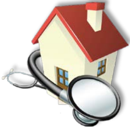
บริการ Home ward