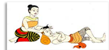
บริการแพทย์แผนไทยและ แพทย์ทางเลือก