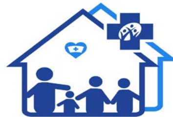
คลินิกพยาบาลชุมชนอบอุ่น สำนักงานหลักประกันสุขภาพแห่งชาติ