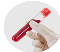
บริการ Lab นอกหน่วย