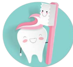
บริการทันตกรรม