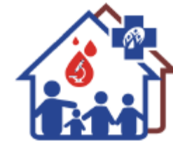
คลินิกเทคนิคการแพทย์ สำนักงานหลักประกันสุขภาพแห่งชาติ