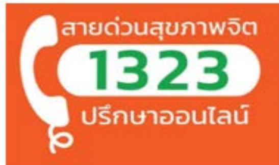
บริการสายด่วนสุขภาพจิต