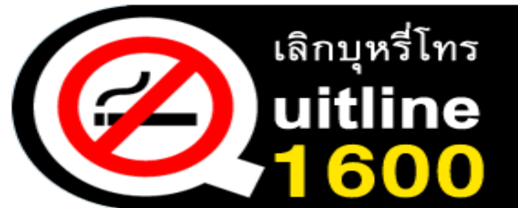
บริการสายด่วนเลิกบุหรี่